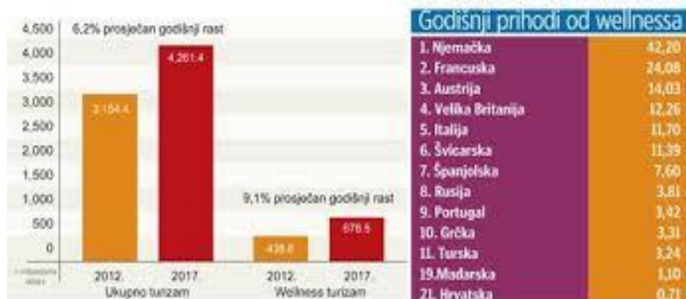
Слика - Годишњи приходи од велнеса у ЕУ